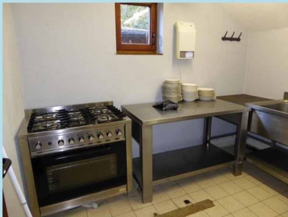
Cuisinière gaz 6 feux + grand four - table de travail en inox