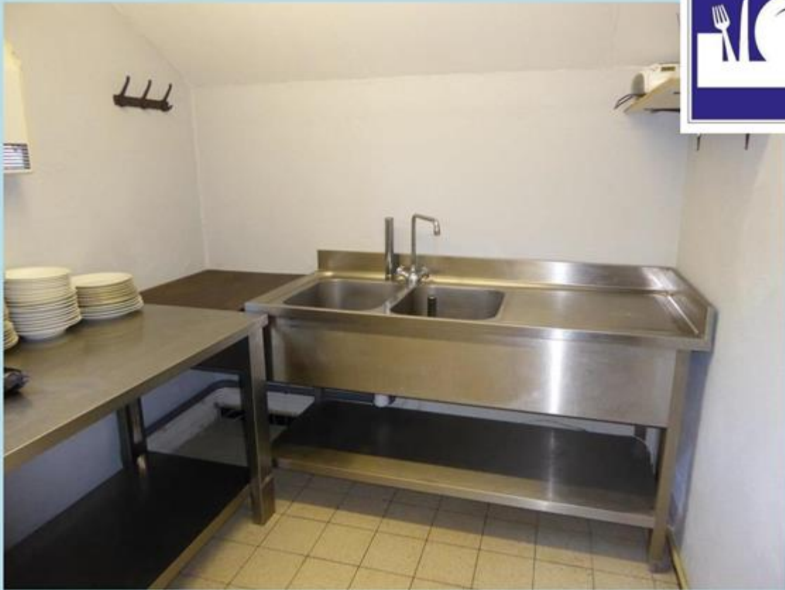
2 grands bacs de plonge + égouttoir en inox